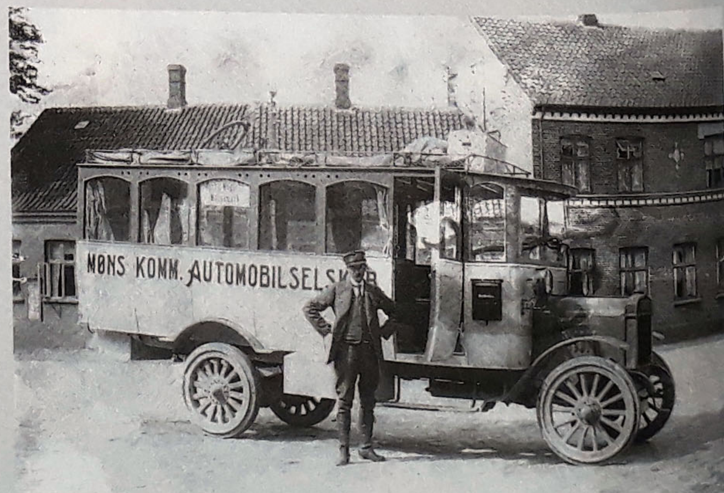
Rutebil fra Møns kommunale Automobilselskab på Gåsetorvet i Stege omkring 1920.