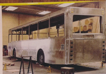
Karrosseri i aluminium under udførelse på fabrikken i Aabenraa ca. 1985.

Udgivet 2021 på forlaget J-bog, hvor den også kan købes. 68 sider og over 70 illustrationer - de fleste i farver. Pris 195 DKK + porto.