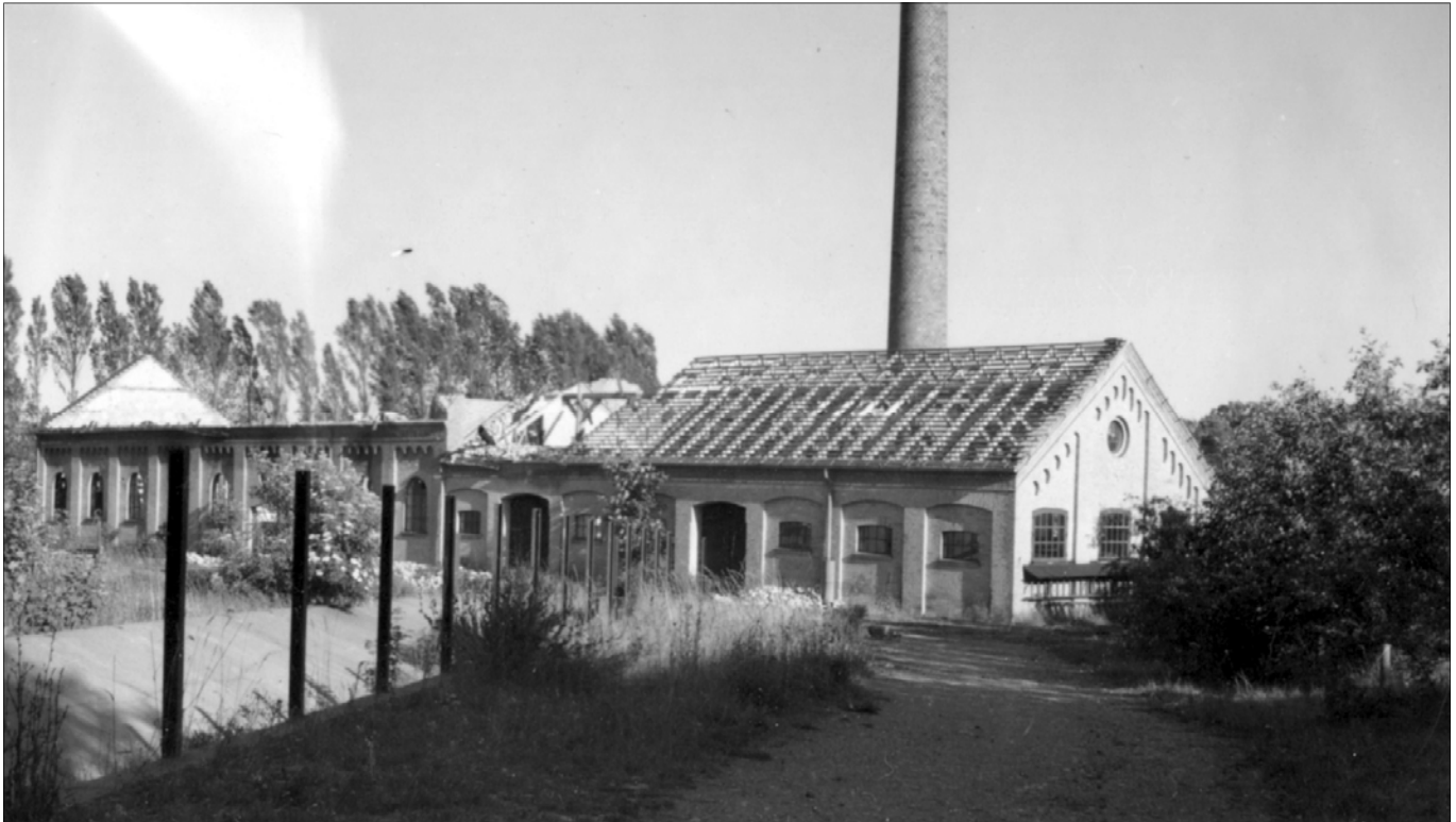
Pollerup Saftstation efter branden i 1947. Til venstre i forgrunden ses en af roerenderne; se også billedet på side 11.